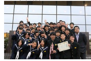
3年 優秀賞 3組