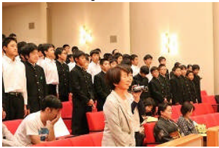
員野様 奥様と娘様