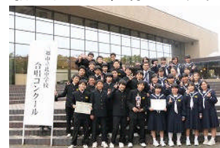
3年 最優秀賞 5組